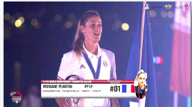
Morgane Planton, championne du monde